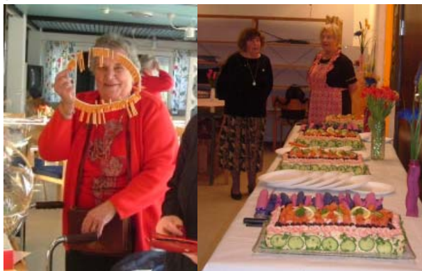
Lotteriförsäljning i väntan på smörgåstårterna .

Alla nettointäkter går oavkortat till att sätta lite guldkant på tillvaron för de boende och övriga pensionärer. T ex när Dragspelsgillet gästar Gustavsgården och 150 personer bjuds på förtäring av Guldkanten. Många från de olika avdelningarna kommer ner och lyssnar på musiken, dansar och sjunger med.