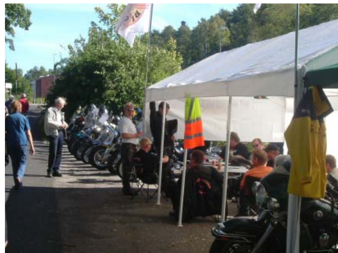
NightBikers och Nattvandrarna på föreningsdagarna 2004.