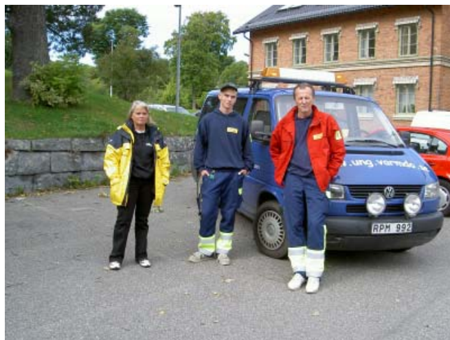
Nattvandrare och Värmdöpolare på föreningsdagarna i Gustavsberg 2005.

Rekryteringen till Värmdöpolarna är inget problem. De som blivit för gamla bildar Gammelpolarna och tar hand om evenemangen som ordnas för ungdomarna, beachvolleyboll-, innebandy- och fotbollsturneringar och disco.