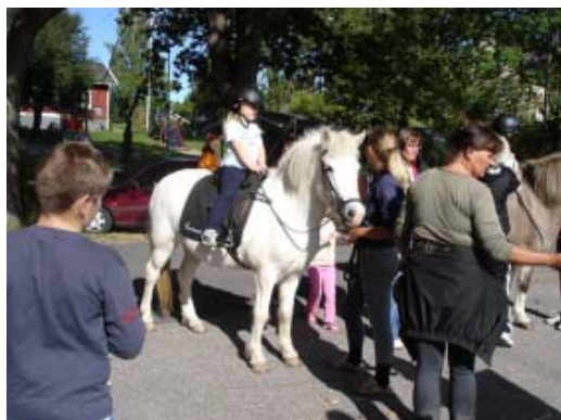
Ponnyridning på föreningsdagarna vid Strandvik 2005

Antalet hästar på Värmdö har nog aldrig varit så stort som nu. Runt 1960-1970 fanns det knappt en viftande hästsvans på Värmdö. Idag finns det snart ett litet eller stort stall i var och varannan buske. Nya anläggningar planeras och byggs oavbrutet. Uppskattningsvis finns det 800 hästar på Värmdö idag – ridhästar av alla raser och storlekar.