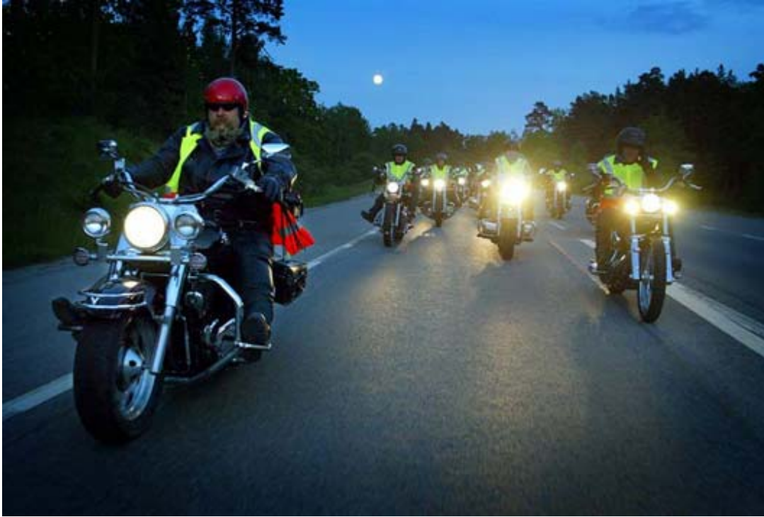
NightBikers i sina gula västar - runt kommunen i sommarnatten

Har Ni sett den, den blåa folkabussen som åker omkring på byn? Alla helger året runt. Det står ung.varmdo.se på motorhuven och Värmdöpolarna på sidan.