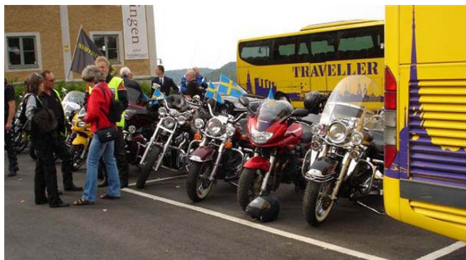
NightBikers eskorterar vid kungabesöket i Värmdö 2005.

Värmdöpolarna försöker ta hand om ungdomar som fått för mycket att dricka och inte kan ta hand om sig själva. De får välja på att antingen bli hemkörda till föräldrarna eller ta en tripp in till Maria Pol.