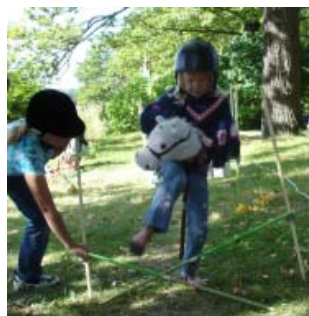
Vision Häst visar käpphäst på föreningsdagarna

Antalet hästar på Värmdö har nog aldrig varit så stort som nu. Runt 1960-1970 fanns det knappt en viftande hästsvans på Värmdö. Idag finns det snart ett litet eller stort stall i var och varannan buske. Nya anläggningar planeras och byggs oavbrutet. Uppskattningsvis finns det 800 hästar på Värmdö idag – ridhästar av alla raser och storlekar.